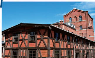
半田赤レンガ建物