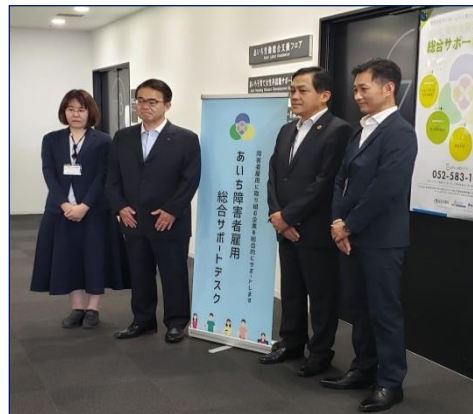
令和元年5月24日サポートデスク開所式