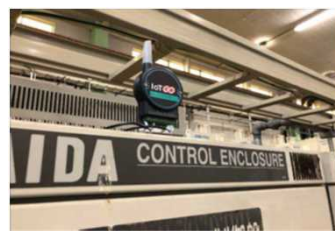
【設備に設置されたIoT端末】