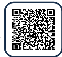
ハローワーク犬山HP