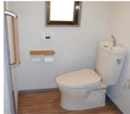
便器の位置、向きの変更