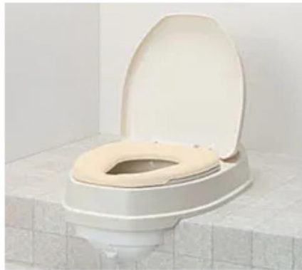
洋式便器等への便器の取換え