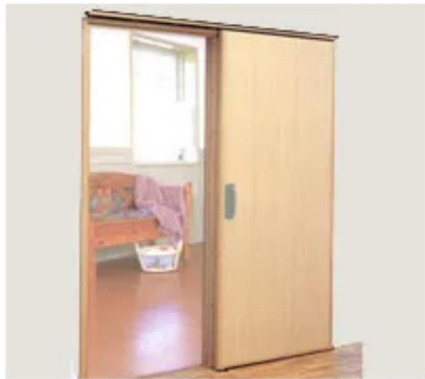
引き戸等への扉の取り換え