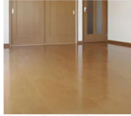
滑りの防止及び移動の円滑化等のための 床又は通路面の材料の変更