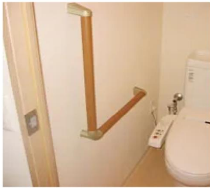
手すりの取り付け