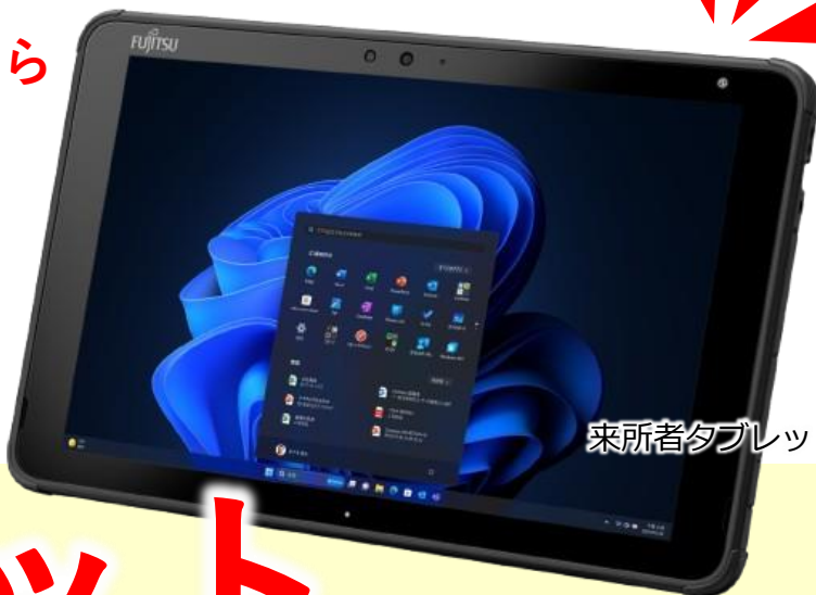
来所者タブレット