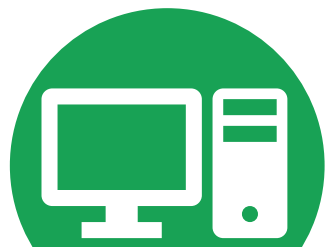
求人検索機 (デスクトップ型端末)