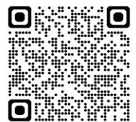
愛知労働局HPはこちら