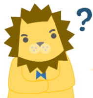
勉強中の教頭先生