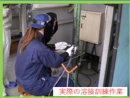
実際の溶接訓練作業

当日は混雑が予想されます。お車で越しの方は 第二駐車場 をご利用ください。 第1部のみの参加、第2部のみの参加でも雇用保険の活動実績になります。 第2部は時間途中の飛び込み参加も可です。