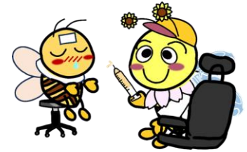
HW豊田マスコットキャラクター「ハロビー」

(注)正社員有効求人倍率＝正社員有効求人数／常用フルタイム(一般)有効求職者数。なお、常用フルタイム有効求職者にはフルタイムの派遣労働者や契約社員を希望する者も含まれるため、厳密な意味での正社員有効求人倍率より低い値となる。