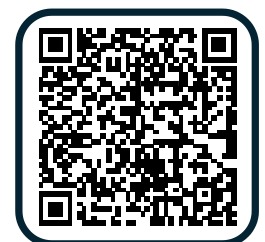
ハローワーク犬山HP

ハローワーク犬山では、求人への応募の可能性を高めるため、求人者のみなさまが作成した「事業所PRシート」をハローワーク犬山庁舎内に掲示するとともに、求職者への配布を行うサービスを開始しました。詳しくは、ハローワーク犬山のホームページの「【求人者のみなさまへ】事業所PRシートを作成しませんか?」をご覧ください。なお、右の二次元コードからも当該ページにアクセスできます。