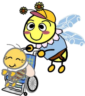
※豊田マスコットキャラクター：ハロピー