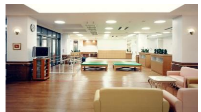
1階リハビリコーナー