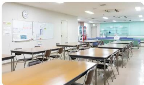
穂ノ原工場食堂・休憩所

本社食堂では、3種類のメニューから選ぶことができます。また、社員の健康増進を目的に「設置型健康社食」を導入。サラダやフルーツなど、健康を意識したメニューを取り揃えています。本社・第二工場・穂ノ原工場では、自由に利用できる給茶機が設置されています。