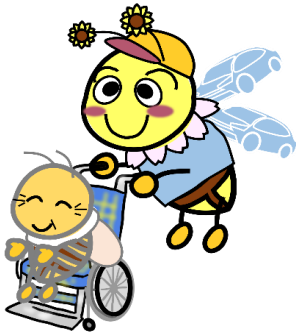
※豊田マスコットキャラクター:ハロピー