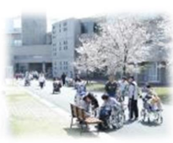
愛厚ホーム豊川苑

遊歩道や緑の丘、グラウンドがあり、 季節感溢れる豊かな環境です。 “笑いと笑顔 共に向上” を掲げて 生活づくりを支援しています。