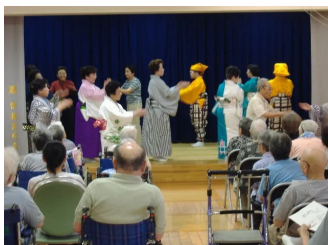
ボランティアによる日本舞踊