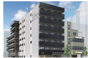
介護付有料老人ホーム サービス付高齢者向け住宅 エイム新栄