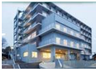
医療介護複合施設 アズーリの丘ごきそ