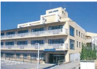
日進老人保健施設