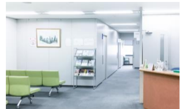
中メンタルクリニック