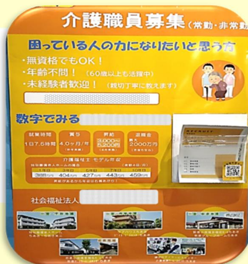
ハローワーク一宮玄関前 (ボードは縦110cm×横90cm)