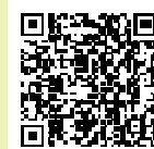
ハローワーク一宮登録フォーム

※通常のリクエストは、来所が必要です。窓口にて希望の求職者条件をお聞きし、該当の求職者を検索して行っています。