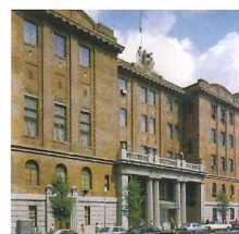
創業当時の本社所在地丸の内・日本工業倶楽部