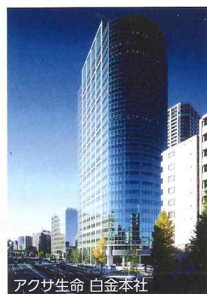
アクサ生命 白金本社