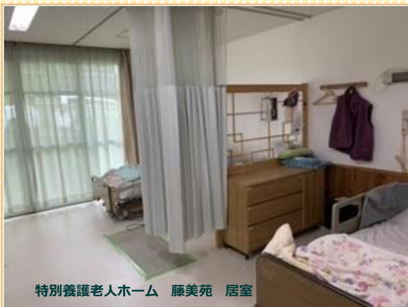
特別養護老人ホーム 藤美苑 居室