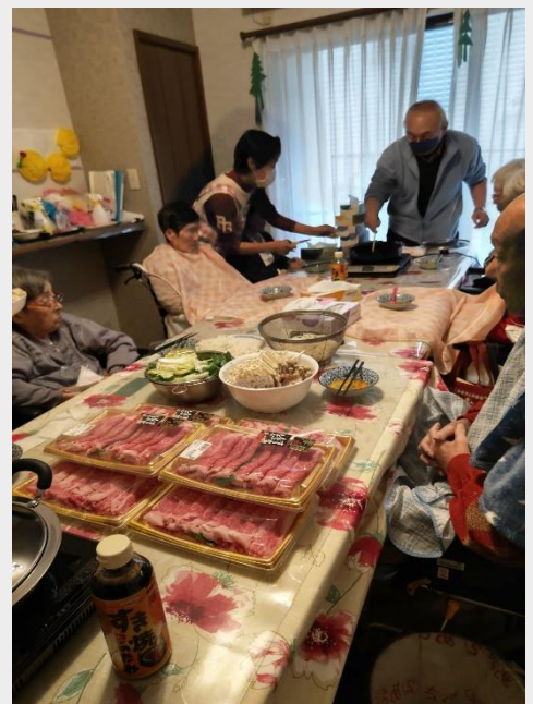
すき焼きパーティー