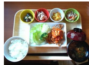
障がい者地域生活サポートセンター1階 「やまぶきちゃんのきつさてん」