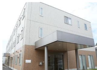
介護付有料老人ホーム