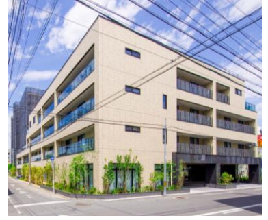
住宅型有料老人ホーム