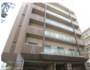
サービス付高齢者向け住宅