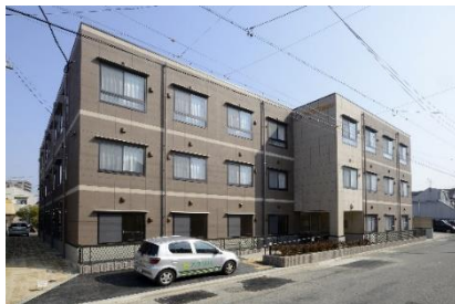
看護小規模多機能型居宅介護 サービス付高齢者向け住宅 認知症対応型共同生活介護