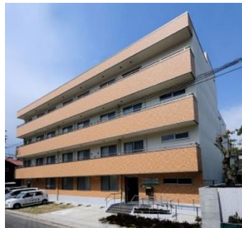
看護小規模多機能型居宅介護 住宅型有料老人ホーム