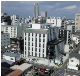
救急指定・医療一般病院 病棟/外来/訪問診療/訪問看護