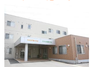
介護付有料老人ホーム