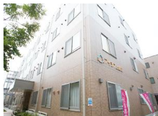
住宅型有料老人ホーム