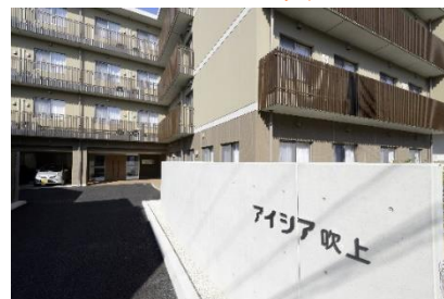
サービス付高齢者向け住宅