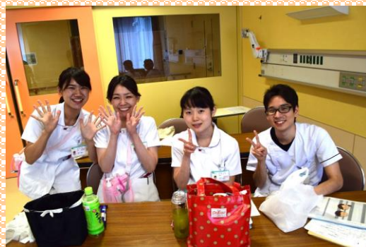
研修の間にホッと一息