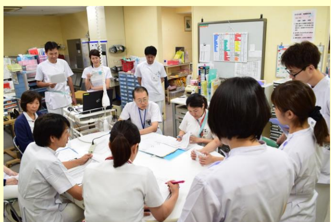
カンファレンスの様子