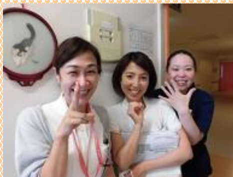
家庭と仕事の両立