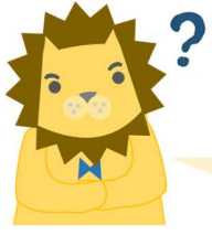
勉強中の教頭先生