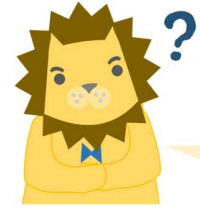
勉強中の教頭先生