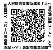
人材開発支援助成金「人への投資促進コース」