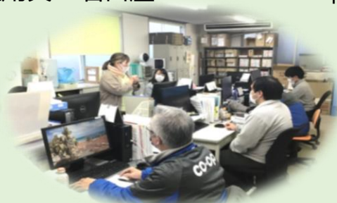
福祉用具・名古屋