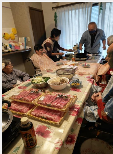
すき焼きパーティー