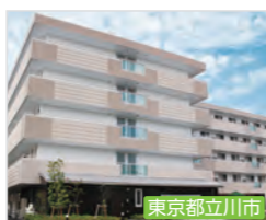
エクセレント立川プレミア 介護付有料老人ホーム