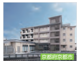
エクセレント西ノ京 介護付有料老人ホーム