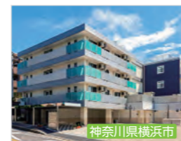
エクセレント横濱北寺尾 介護付有料老人ホーム