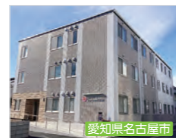
エクセレント熱田 高齢者グループホーム