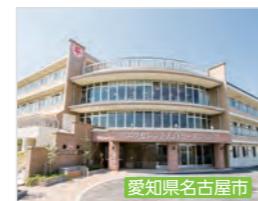
エクセレント天白ガーデンヒルズ 介護付有料老人ホーム