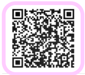
令和4年度雇用保険料率のご案内 リーフレット

令和4年10月1日から、労働者負担・事業主負担の保険料率が変更となります。 年度の途中から保険料率が変更となりますので、ご注意ください。 詳しくはリーフレットをご覧ください。