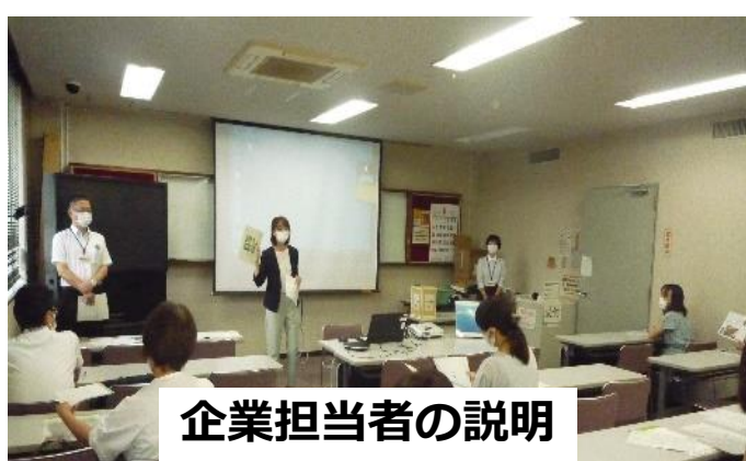
企業担当者の説明