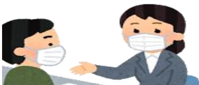
担当者と個別面談（希望者のみ）

Zoomを用いて職場の様子を見学します。 働いている従業員へのインタビューも実施します。 見学中に企業担当者へ質問することもできます。