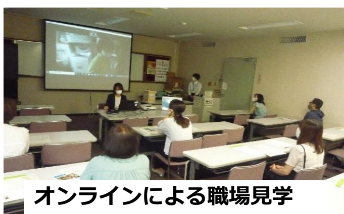
オンラインによる職場見学

Zoomを用いて職場の様子を見学します。 働いている従業員へのインタビューも実施します。 見学中に企業担当者へ質問することもできます。