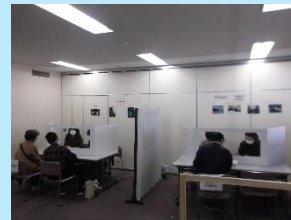
コロナ感染拡大防止のため間隔を広くもち、参加者の検温だけでなく、換気や対応ごとの消毒などの対策をとりながら実施致しました。