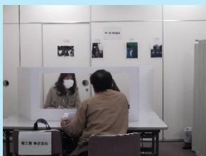
個別ブースでは事業所の方と、笑顔でご相談される方もおり予約制のため、時間内に1人1人じっくり相談ができました。

現場作業員、土木作業員、施工管理技士などの求人を揃えた事業所 2社 が参加、各社のブースでのべ 8名 の方が面談されました。ご相談の結果、3月12日時点でのべ 2名 の方が職場見学・面接等に進むことになりました！！