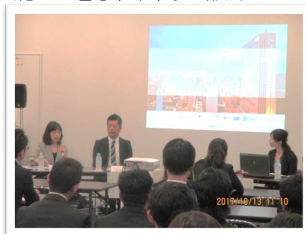
《2017年企業&元留学生トークセッションの様子》