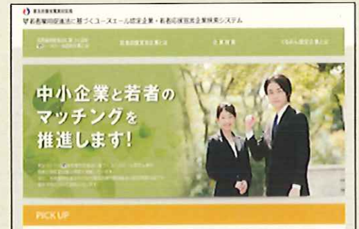
「ユースエール認定企業・若者応援宣言企業検索システム」

個別企業ごとに企業概要、雇用管理の状況、求職者に向けたメッセージなどを掲載することで、積極的な企業情報の発信と若者とのマッチングを促進していきます。