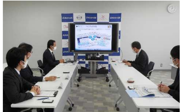
訪問時の様子（林代表取締役より取組状況の説明） 右が島根労働局