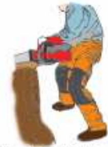
（図7）下肢の切創防止用保護衣

＜注意1＞（図7）で例示した下肢の切創防止用保護衣は、前面にソーチェーンによる損傷を防ぐ保護部材が入っており、JIS T8125-2に適合する防護ズボン又は同等以上の性能を有するものを使用してください。また、労働者の身体に合ったサイズのもを着用してください。既にソーチェーンが当たって繊維が引き出されたものなど、保護性能が低下しているものは使用しないようにしてください。