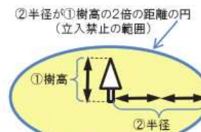
（図6）立入禁止の範囲

〈注意〉 立木を伐倒するときには、周辺の全ての労働者に合図により的確に情報伝達を行い、立入禁止の範囲から、伐倒作業に従事する労働者以外の労働者が退避したことの確認を徹底してください。