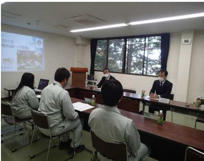
久知良局長と若手社員の皆様との意見交換の様子

☞久知良局長は、「新しい技術をしっかり取り入れている部分と、人と人との繋がりをしっかり作っていこうという部分とバランスよく取り組まれているという印象を受けました。また、本当によく人材を育てられていると思いました。是非これからも業務の効率化を進めていかれながら、安全な職場を作っていただければと思います。」などと応じました。