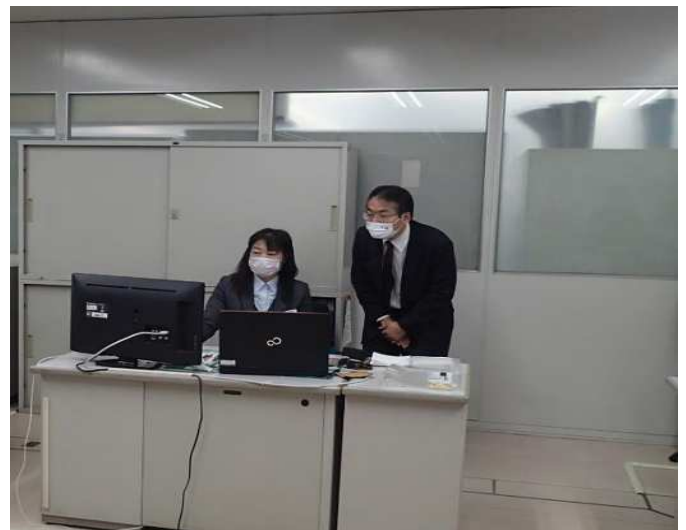
労務管理専用システムの説明を受ける様子