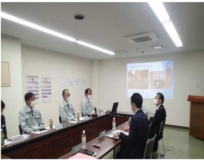
田部井社長（左側奥）、管理職員と久知良局長（右側奥）の対談の様子