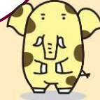
新座市イメージキャラクター 「ゾウキリン」