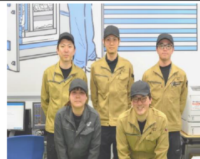
和やかな雰囲気のある職場！