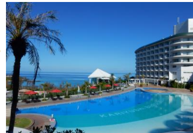
沖縄かりゆしビーチリゾート オーシャンスパ