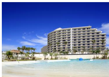
ホテルモンレ沖縄 スパ&amp;リゾート