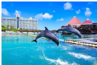
ルネッサンスリゾートオキナワ

接客が得意！多国籍の方と関わりたい！料理が好き！！などなど…一度でも考えたことのある方、ぜひホテルのお仕事も検討してみませんか。