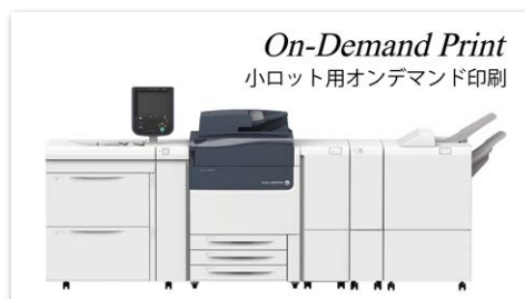
▲富士フィルム製オンデマンドプリンター導入。