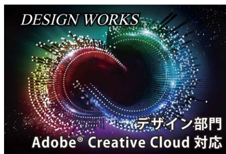
▲デザイン部門、Adobe クリエイティブクラウド導入。