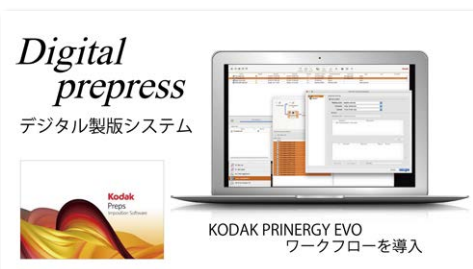
▲コダック社製デジタルプリプレスシステムを導入。