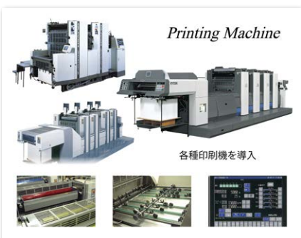
▲弊社導入印刷機の一部。リョービの4色機をはじめ、複数台が稼働。