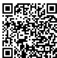
▲申し込みフォーム

※オンライン相談は月～金曜日（祝日及び12/29～1/3を除く）の10:00～16:00です。 ※新潟県の移住相談窓口「にいがた暮らし・しごと支援センター」（東京都千代田区大手町）の相談スペースやタブレットを使用して相談することも可能です。