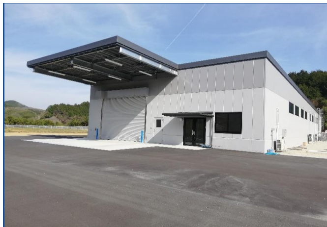
令和4年7月に稼働開始した新工場