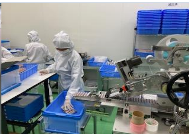
品質確保のための検査工程