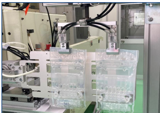
最新設備による製造工程