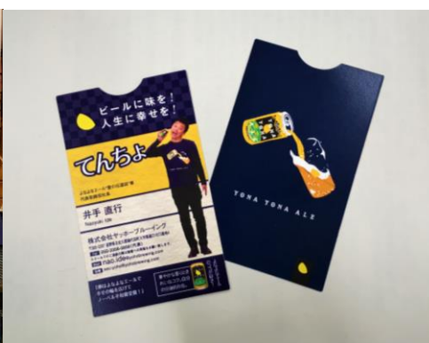
ニックネームの名刺