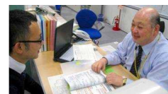
業界に精通した専任がマンツーマンでサポート!