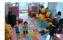
全オフィスに保育士を常駐 安心してお仕事探しに専念