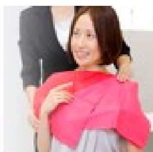
〈パーソナルカラー〉