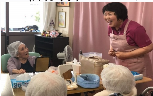
〈化粧品療法レクレーション〉