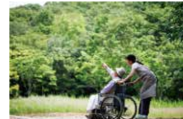
介護イメージ写真