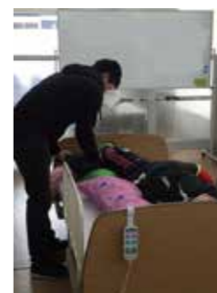
介護職員初任者研修実技風景