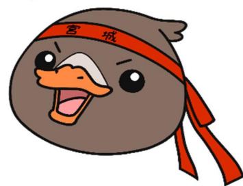
みやぎハローワークキャラクター「ガンちょーさん！」

「ガンちょーさん」は宮城県の県鳥、ガン(雁)をモチーフに、働く人と企業 を応援する応援団をイメージしたみやぎハローワークのキャラクターです。