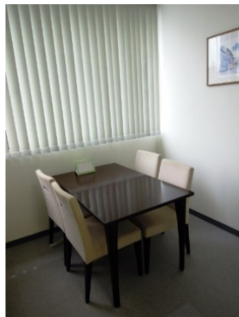
カウンセリングルーム